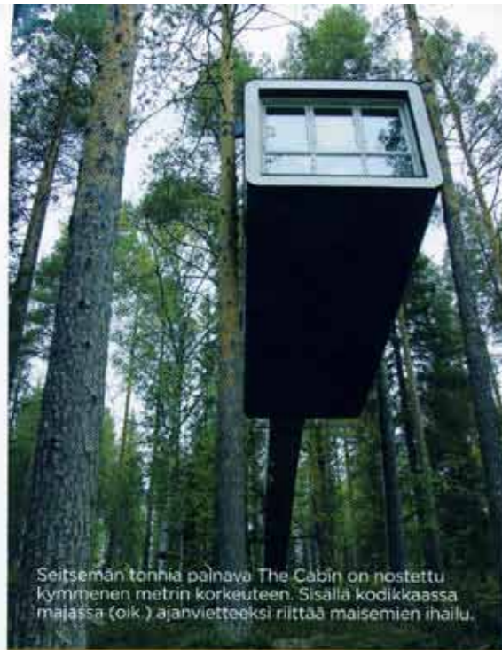
Seitsemän tonnia painava The Cabin on nostettu kymmenen metrin korkeuteen. Sisällä kodikkaassa majassa (oik.) ajanvietteksi riittää maisemien ihailu.