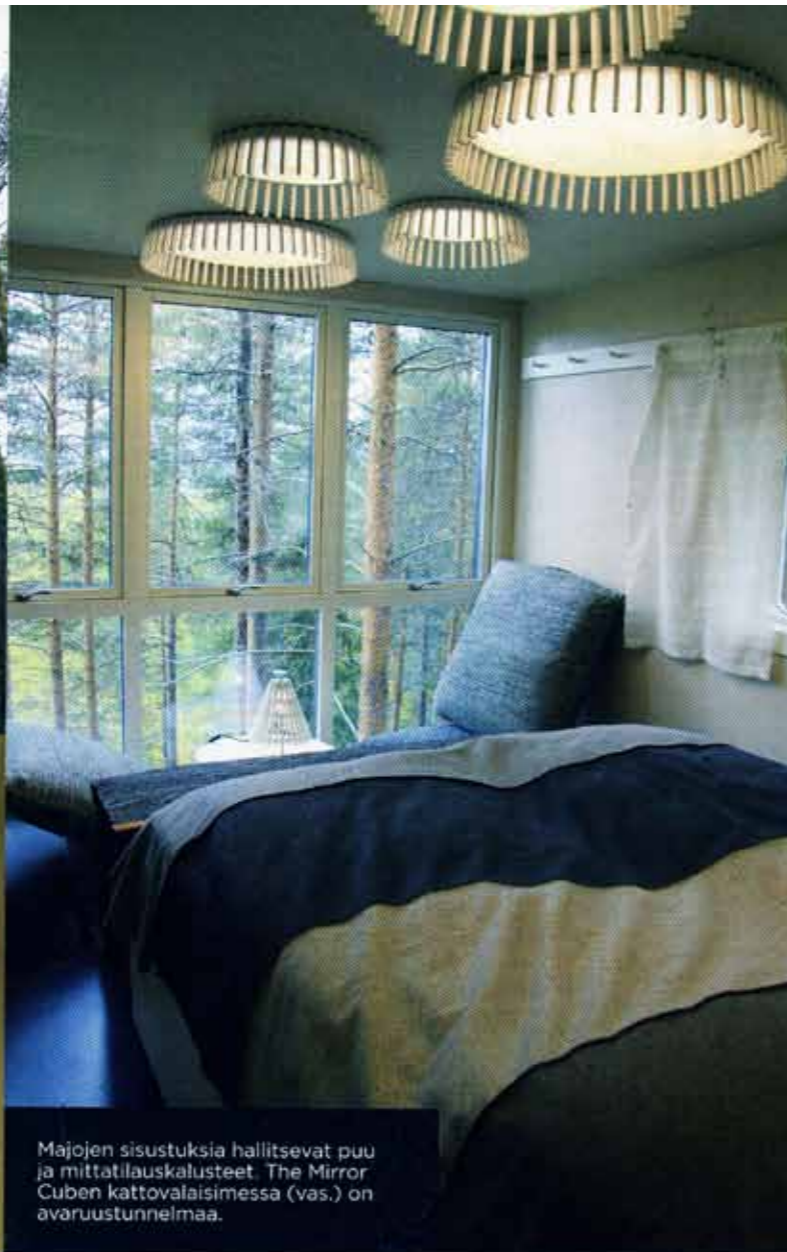
Majojen sisustuksia hallitsevat puu ja mittatilauskalusteet. The Mirror Cuben kattovalaisimissa (vas.) on avaruustunnelmaa.

vivät työhön. Huoneet tuotiin mahdollisimman valmiiksi rakennettuina Haradsiin. Niiden asentamisessa puihin ei käytetty nauloja eikä ruuveja, ainoastaan vajioreita ja säädettäviä kiinnitysrenkaita. Säätövaraa tarvitaan, sillä puut kasvavat paksuutta koko ajan.